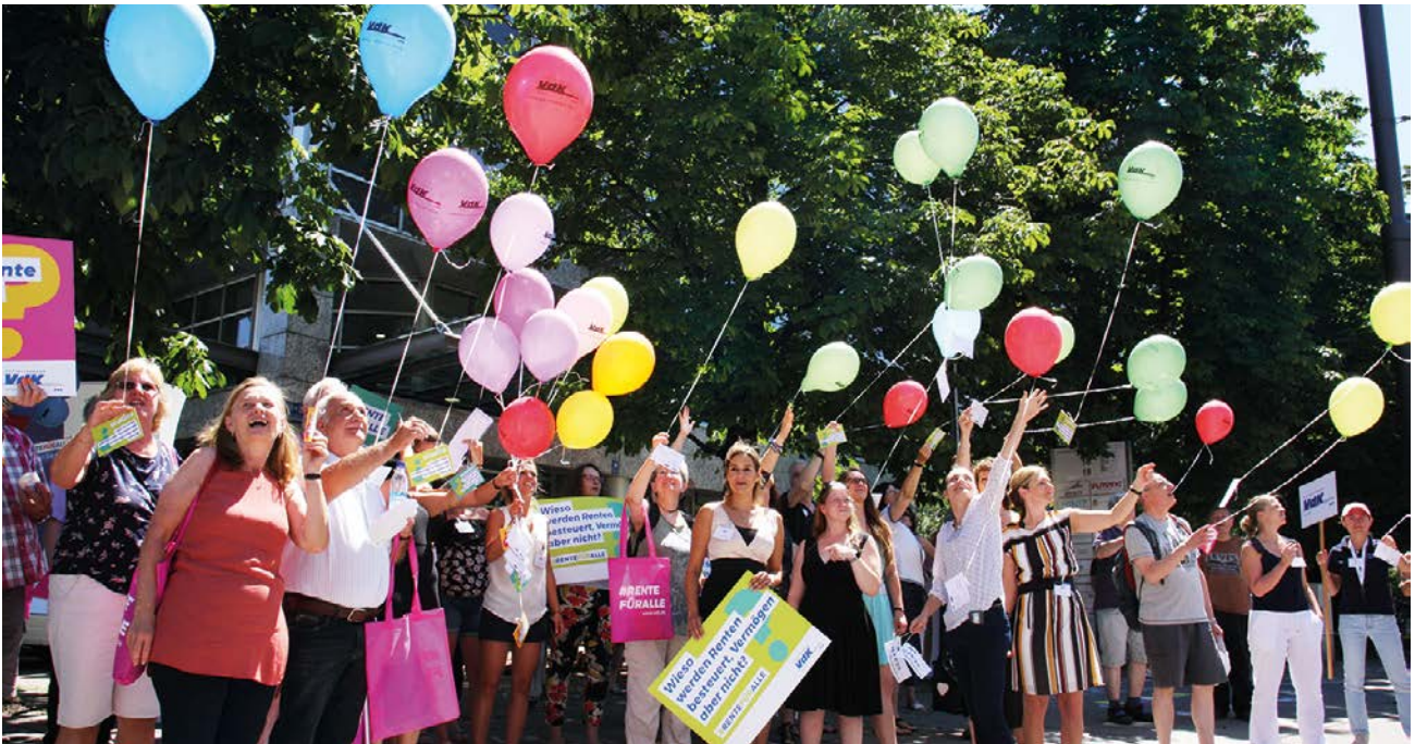
Rente für alle! An Luftballons schweben bei dieser Aktion in München VdK-Forderungen in den Stadthimmel.