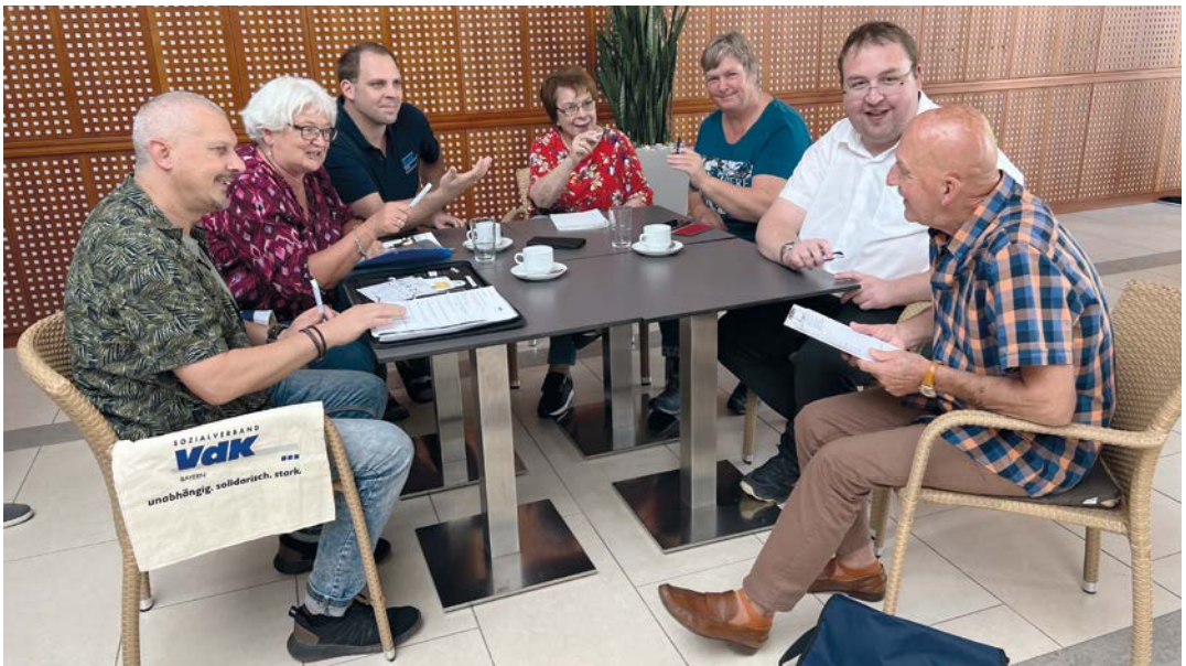
Teamsitzung im VdK-Ehrenamt