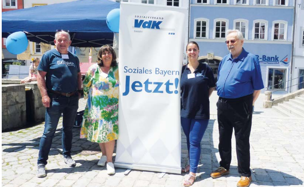
Mitgliederbetreuung am VdK-Aktionstag in Landsberg.