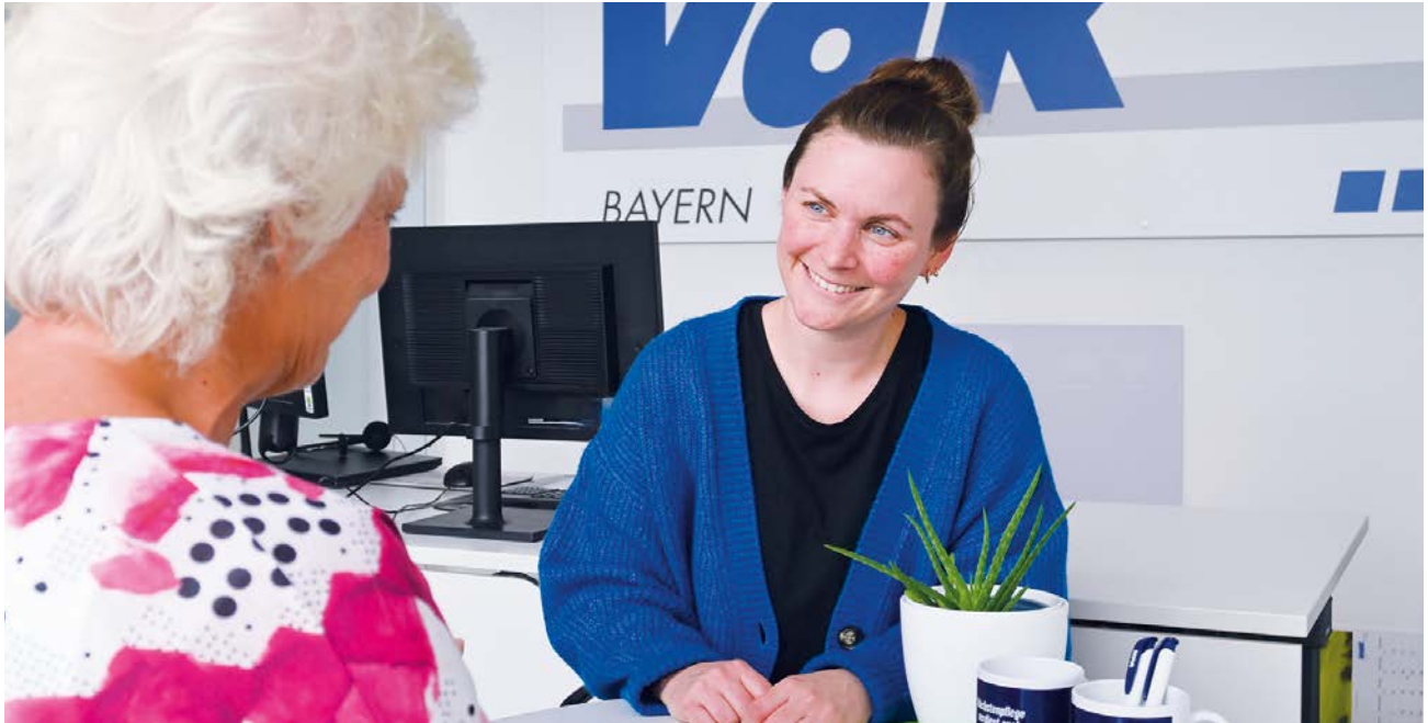
Zu Recht kommen: In unseren VdK-Geschäftsstellen werden die Mitglieder sozialrechtlich beraten.