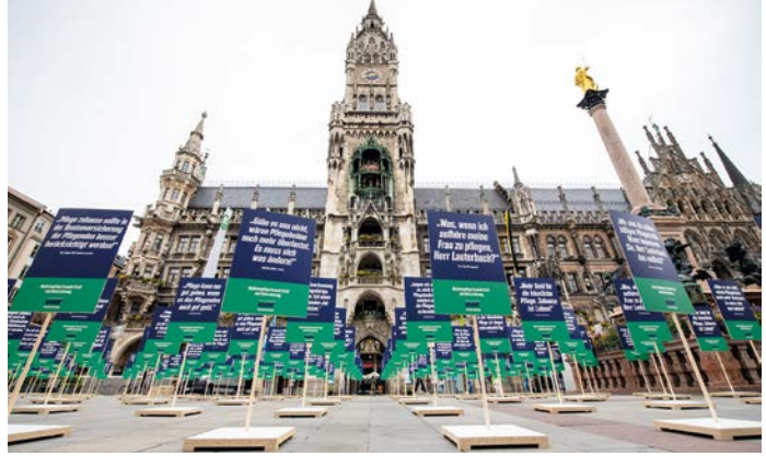
Stille Demo zur VdK-Pflegekampagne in München 2022.