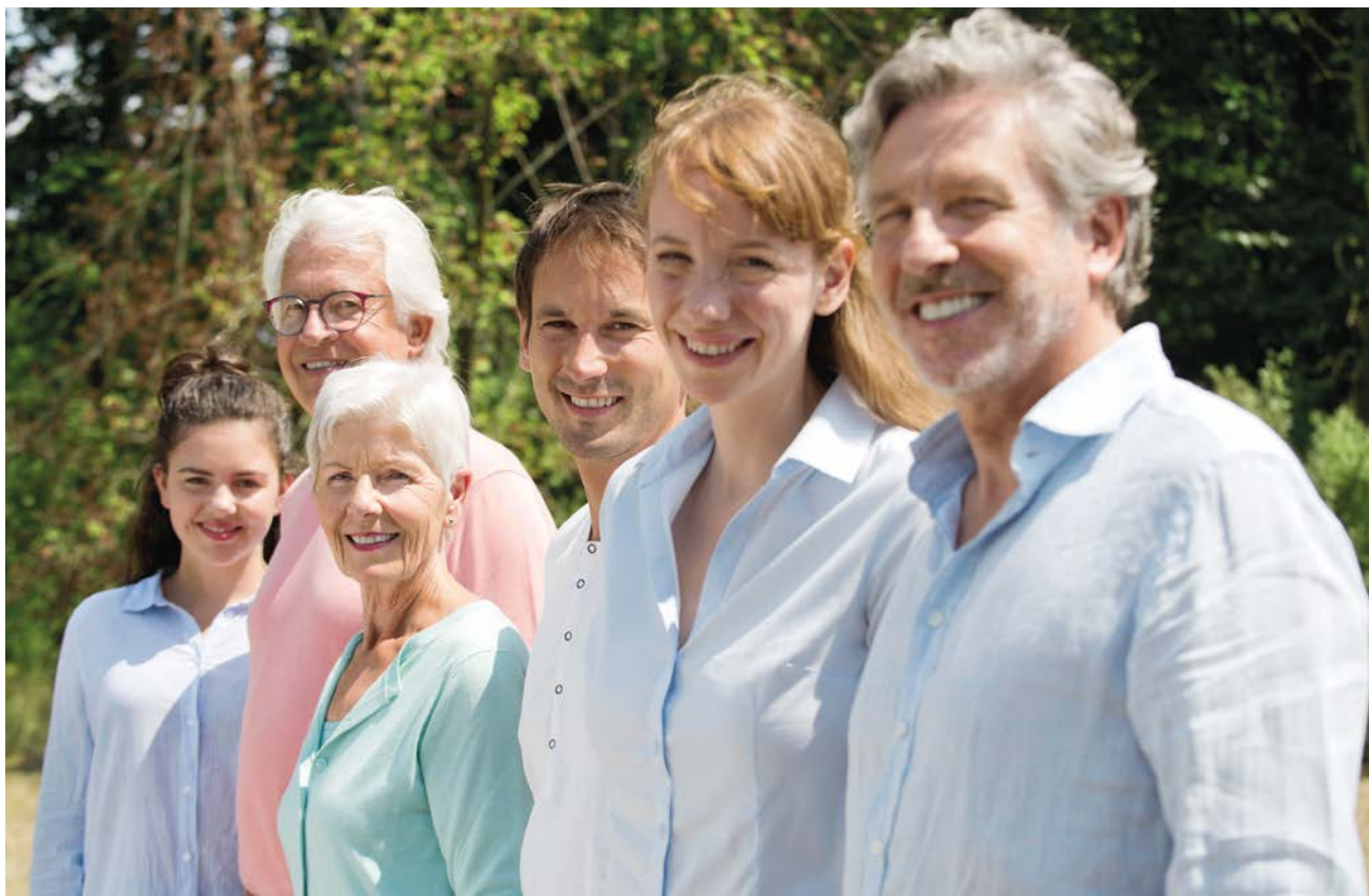
Der Sozialverband VdK setzt sich für alle Generationen ein.

Sie haben in diesem Kapitel die Werte unseres Sozialverbands kennengelernt.