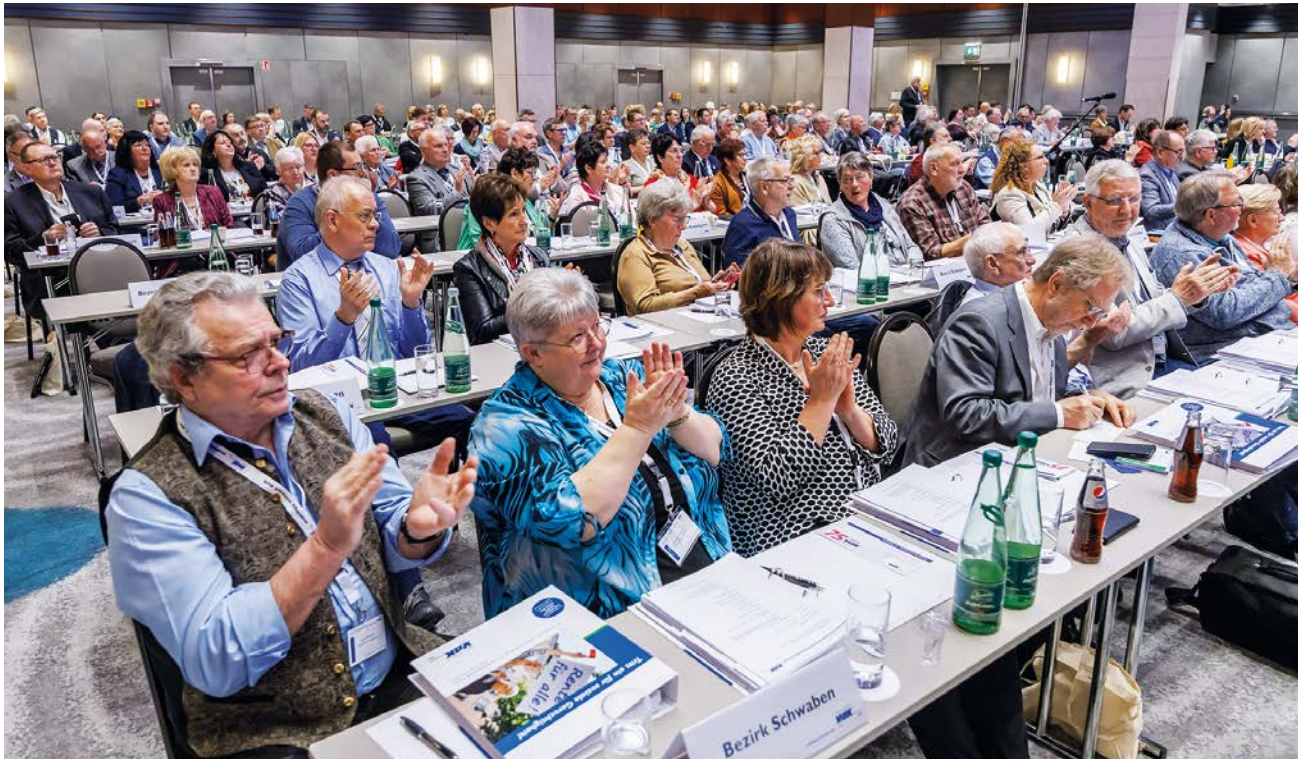
Auf dem Landesverbandstag gestalten die Ehrenamtlichen gemeinsam die Zukunft des VdK Bayern.