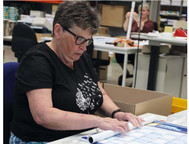
Hier werden Jahresplaner von einer Mitarbeiterin der Dimetria verpackt.