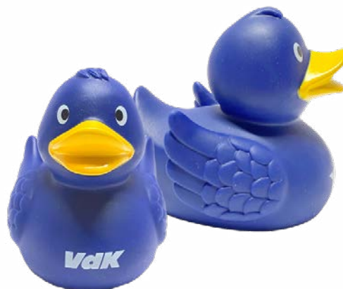
Die „VdK-Enten“ sind ein beliebter Werbeartikel, zu bestellen beim Inklusionsbetrieb Dimetria.

Im Online-Shop unter vdk.print-server.net können Sie auch einen umfangreichen E-Mail-Versand organisieren lassen. Sollen Ihre Mitglieder gemischt per Post und E-Mail erreicht werden, können Sie bei Dimetria auch ein „hybrides Mailing“ bestellen.