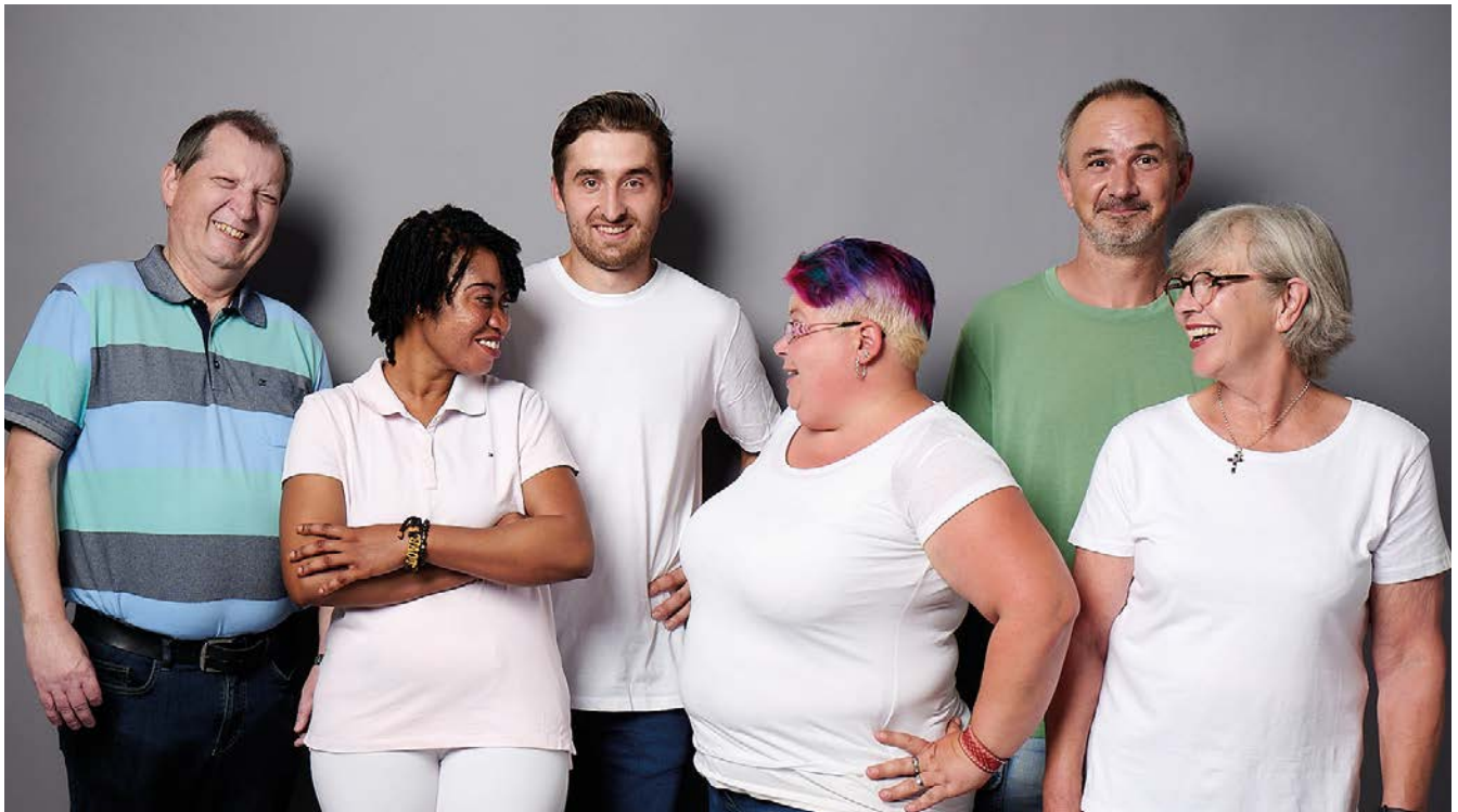
Der VdK Bayern steht für Vielfalt und Solidarität