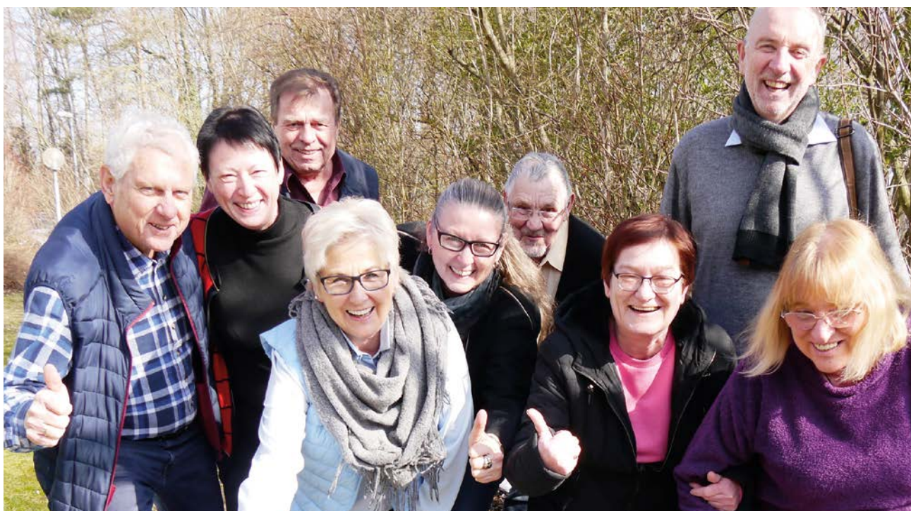
Wir sind eine Gemeinschaft: Erfolge feiert man am besten gemeinsam.

Immer wieder gibt es VdK-Mitglieder, die tatkräftig helfen, obwohl sie nicht Teil der Vorstandschaft sind. Hier backt mal jemand einen Kuchen, dort stellt jemand Bänke auf. Erwähnen Sie diese Menschen auf Versammlungen, bedanken Sie sich bei Ihnen. Feiern Sie die gemeinsamen Erfolge mit Ihrem Team, und bedanken Sie sich für die Unterstützung. Ein Lob oder ein Dank sollte möglichst persönlich sein. Der eine freut sich über eine Geburtstagskarte, eine andere ist dankbar für einen Blumenstrauß. Die namentliche Erwähnung, zum Beispiel im Jahresbericht, in einem Zeitungsartikel, auf einer Kreisarbeitstagung oder auf der Mitgliederversammlung, ist eine besondere Ehrung. Für andere ist die Dankbarkeit derjenigen Menschen, denen sie helfen konnten, das schönste Geschenk.