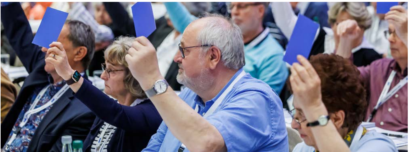
Auf dem VdK-Landesverbandstag 2023 stimmten die ehrenamtlichen Delegierten über die Verbandsziele ab.

Auf Ortsverbandsebene werden die Mitgliederbetreuung und das kommunale sozialpolitische Engagement organisiert. Die Ortsverbände werden von den Ortsvorständen geführt, die von den Mitgliedern mindestens alle vier Jahre neu gewählt werden. Sie wählen außerdem die Delegierten für den Kreisverbandstag.