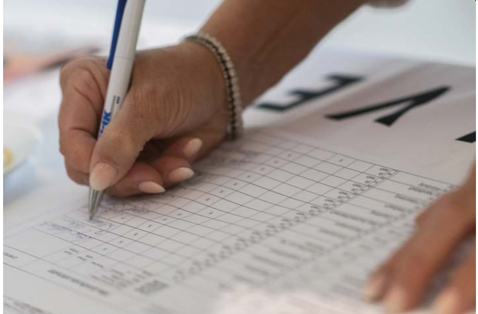
Teilnahmelisten müssen sorgfältig geführt werden.