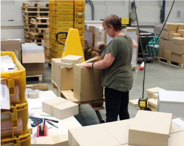
Eine Mitarbeiterin der Dimetria bereitet die Versendung von VdK-Broschüren vor.