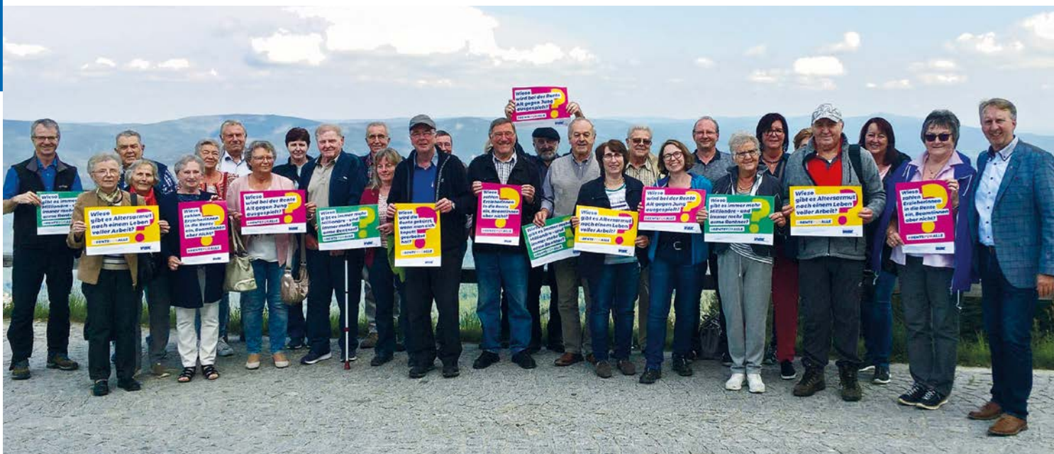
Perfekter Anlass für eine Berichterstattung: kleine VdK-Demo auf dem Arber.

Lokalredaktionen freuen sich in der Regel über gute Beiträge aus den Vereinen. Dennoch veröffentlichen sie nicht jeden Text. Suchen Sie als Presseverantwortliche/-r das Gespräch mit der Redaktion, stellen Sie sich und den Ortsverband vor und fragen Sie nach, wie sich die Zusammenarbeit gut gestalten lässt. Bieten Sie aktiv Themen an, zum Beispiel eine Reportage über ein besonders aktives ehrenamtliches VdK-Mitglied.