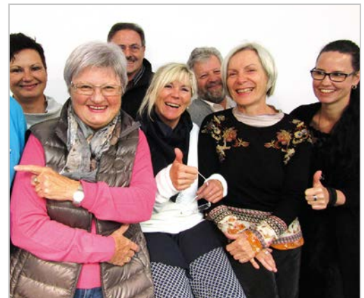
Als VdK-Lotse oder Lotsin helfen Sie Mitgliedern in der VdK-Kreisgeschäftsstelle bei sozialen Fragen.

Die Wege ins Ehrenamt sind vielfältig und bunt. Mit dem Ehrenamtsquiz lässt sich spielerisch schnell herausfinden, welches Ehrenamt zum interessierten Mitglied passt. In Papierform erhältlich in unserer Broschüre „Ehrenamt im Sozialverband VdK Bayern“