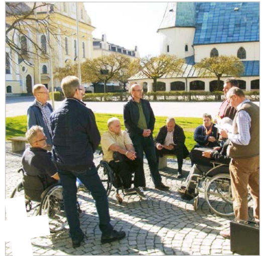
Bei einer Ortsbegehung werden Barrieren aufgespürt und protokolliert.