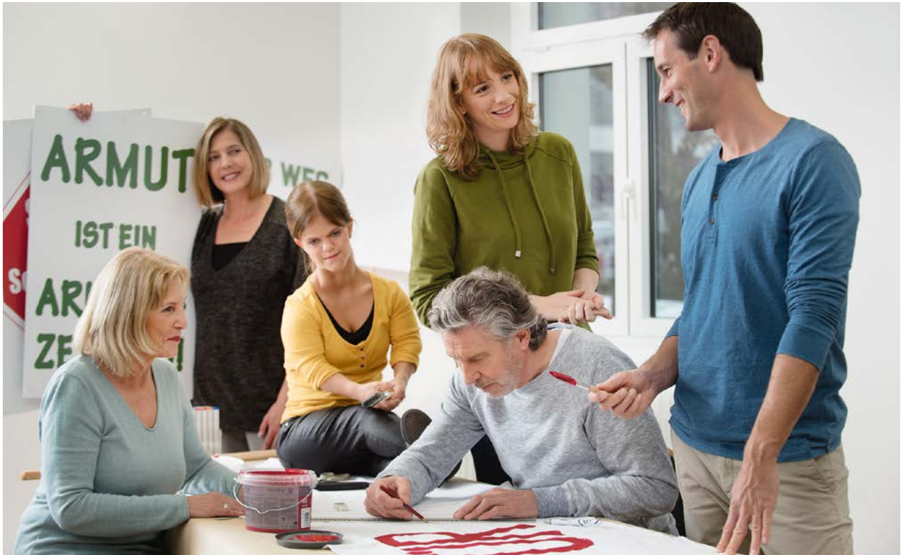
Gemeinsam eine VdK-Aktion zu planen, macht allen Spaß. Hier kann sich jedes Teammitglied einbringen.

Erfolge sind immer Team-Ergebnisse, genauso wie Misserfolge – beides wird geteilt.