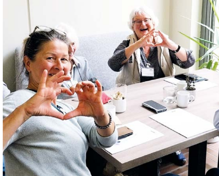
Ehrenamt im VdK bringt Freude und Gemeinschaft