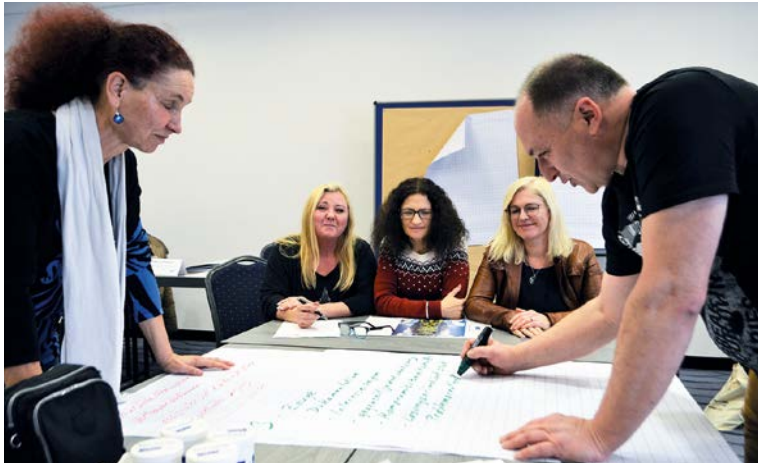
Kommunikation ist das A und O der Teamarbeit.