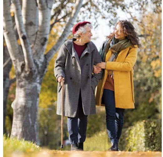
Als Pflegebegleiterin schenken Sie Zeit und Aufmerksamkeit