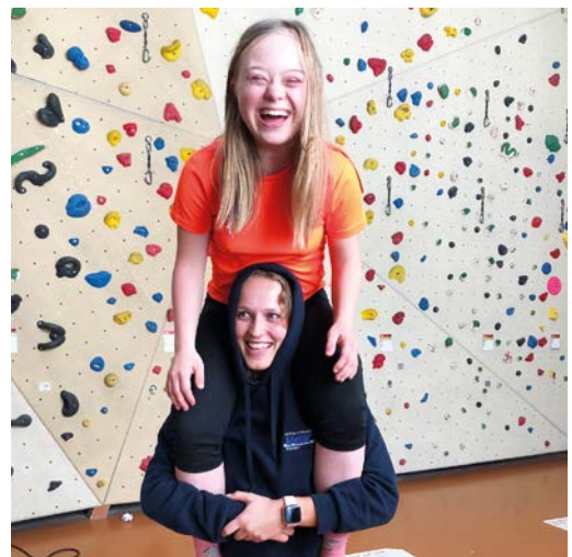
Parole Spaß haben! Auf den VdK-Freizeiten ist Lachen inklusive.