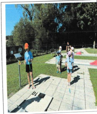
Hier wird gefachsimmelt