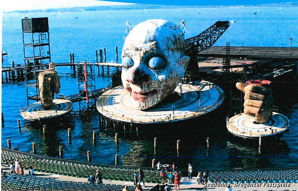
Seebühne, Bregenzer Festspiele