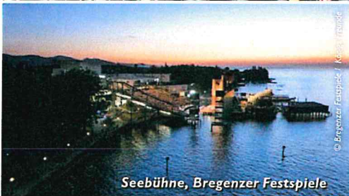
Seebühne, Bregenzer Festspiele