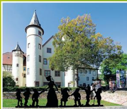
Die Schneewittchensilhouette befindet sich vor dem Schloss. You will find Snow White's silhouette in front of the castle.

Are you ready for the Snow White rally? Just look for the dwarfs' pointed caps and answer the questions you'll find under them. Then hand in the card with your answers at the tourist information office, or just put it in the letterbox at the door. Cards completed with all the correct answers will be included in a prize draw. The judges' decision is final and legally binding.